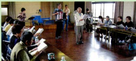
春田公民館にて。高齢者はつらつ長寿推進事業での活動風景。

A3 みなさんに喜んでいただけることが何より嬉しく、生きがいと自信を持つことができました。仲間ができて明るくなり、生活が楽しくなりました。