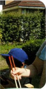
中庭にて、流しソー 用者が、流しソーメン 者の分まで食べる