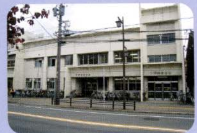
中川福祉会館・児童館全景