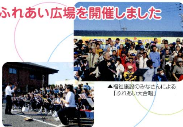
▲福祉施設のみなさんによる「ふれあい大合唱」

また、点字や手話、作業所での作業を体験する「福祉体験スタンプラリー」や全員参加のビンゴ大会など、秋晴れの中、みんながふれあう賑やかなまつりとなりました。