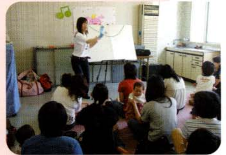
絵本とあそび(第1・3木曜)／ 乳幼児と保護者が絵本・音楽を使って楽しめます。

なっちゃん：「でも放課後や土日は小学生でいっぱいだけど、学校がある日の昼間は誰も 来れないね。」 あきちゃん：「そんなことはないよ。1～3歳くらいの小さい子や 子育て中のお母さんが自由に参加できるクラブ もあるんだよ。児童館は子育ての活動も応援しているんだ。」