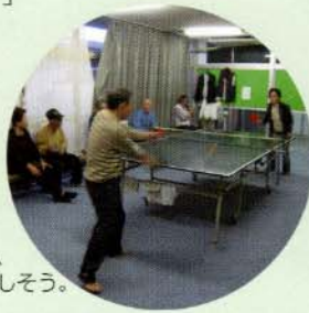
冗談を交えながら、和気あいあいと楽しそう。

ツル：「囲碁や将棋、卓球は毎日自由に参加できますよ。頭や体の体操になると大人気なんです。あと、福祉会館にはお風呂があるので13時15分から14時30分まで入浴ができますよ。」