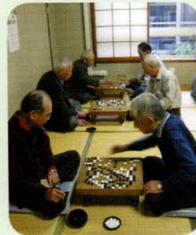
囲碁を打つ姿も真剣です。

亀太郎：「さっき、「わくわくクラブ」という看板を見たけど、何をしているのかな？」