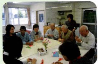
今日のわくわくクラブは「花まゆ芸芸」。キレイな花にできあがるかな？