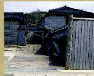
平成19年 能登半島地震被災地の様子

平成17年10月の事業開始以来、すでに90件程度のお宅で金具を取り付けてきました。一人ひとりの備えが、まち全体の震災被害を軽減することにつながります。お気軽に本会までご連絡ください。