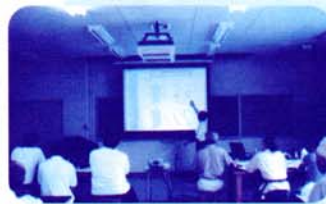
金具について説明を受ける受講生