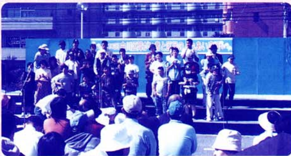
富田作業所によるメロディベルの演奏

10月15日（日）中川区役所にて「第18回中川区障がい者と区民のふれあい広場」を区内福祉施設・団体による実行委員と、ボランティアのみなさんの協力をいただき開催しました。